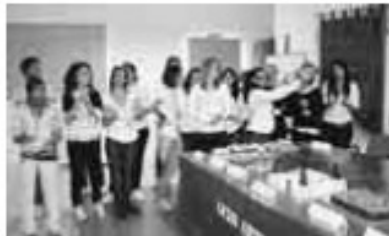
LA PRESENTAZIONE DELLE TORTE