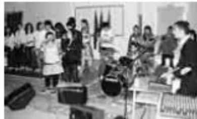
ESIBIZIONI MUSICALI E CANORE